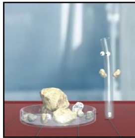
Abb. 2: Der erste Entwurf zu den Avataren.

Zurück zum Thema Seltene Erden: Zum jetzigen Zeitpunkt ist es uns möglich die Spielebenen genauer zu beschreiben.