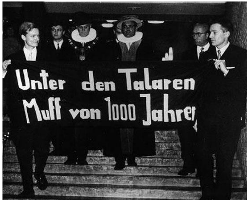
Abbildung 2: Mit der schmissigen Parole „Unter den Talaren den Muff von 1000 Jahren“ zog die Studierendenbewegung der Sechziger Jahre ins Feld.

Die FU ist aber nicht nur ein Ort der Lehre und Forschung, sondern traditionell schon immer ein Zentrum politischer Aktivität. War sie als intellektuelles Bollwerk gegen die marxistisch-leninistische Doktrin errichtet