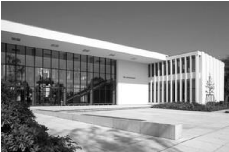
Abbildung 2: Henry-Ford-Bau.

sitzende des Gründungsausschusses, am 4. Dezember 1948 im Titania-Palast die Eröffnung der neuen Hochschule mit dem äußerst provokanten Namen „Freie Universität Berlin“. An beiden Universitäten gleichzeitig zu studieren war nicht nur undenkbar, sondern auch verboten.