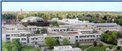
Holz-, Rost- und Silberlaube