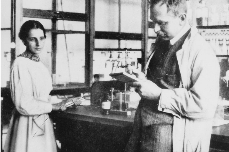
Abbildung 3: Lise Meitner und Otto Hahn, die Entdecker der Kernspaltung, im damaligen Kaiser-Wilhelm Institut für Chemie (heute Hahn-Meitner-Bau), 1928.

Doch auch bevor die Freie Universität gegründet wurde, gab es auf dem Campus Dahlem bereits einige hoch angesehene Institute. Auch die eine oder andere Wissenschaftler*in, die euch mit Sicherheit noch im Studium begegnen wird, hat hier geforscht. So wurde im heutigen Institut für Biochemie (Hahn-Meitner-Bau) die Kernspaltung von Otto Hahn, Lise Meitner und Fritz Strassmann entdeckt und sogar Albert Einstein soll einen Teil seiner wohl bekanntesten Arbeit zur Relativitätstheorie hier in Dahlem verfasst haben.