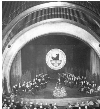
Abbildung 1: Gründungsfeier der FU Berlin im Titania-Palast, am 4. Dezember 1948.

Als 1948 zunehmend Studierenden aufgrund ihrer politischen Aktivitäten vom Studium ausgeschlossen wurden, mehrten sich die Stimmen, die angesichts dieser ideologischen Diskriminierung eine eigene „UdeWe“ forderten („Universität des Westens“). So verkündete Ernst Reuter, der Vor-