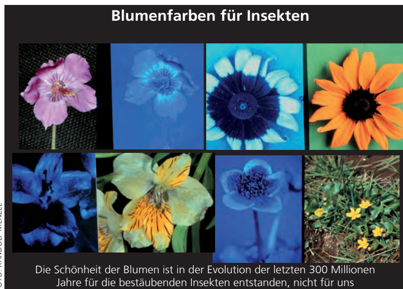
Die Schönheit der Blumen ist in der Evolution der letzten 300 Millionen Jahre für die bestäubenden Insekten entstanden, nicht für uns