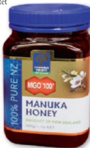
Manukahonig erzielt auch in Deutschland hohe Preise.