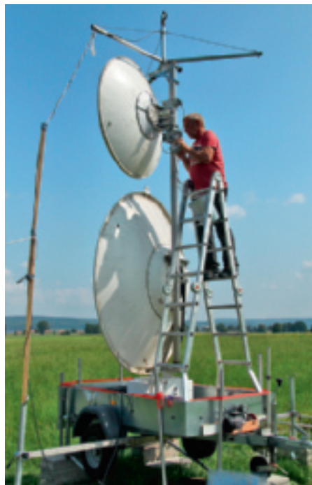
Mit dieser Radarstation werden die Bienen geortet. Fotos und Grafiken: Randolph Menzel

signal auf und sendet es unter einer anderen Frequenz wieder aus. Der Empfänger unseres Radargeräts gibt uns alle drei Sekunden an, wo die Biene sich gerade befindet. Wir können damit einen Radius von etwa einem Kilometer um das Radargerät herum absu-